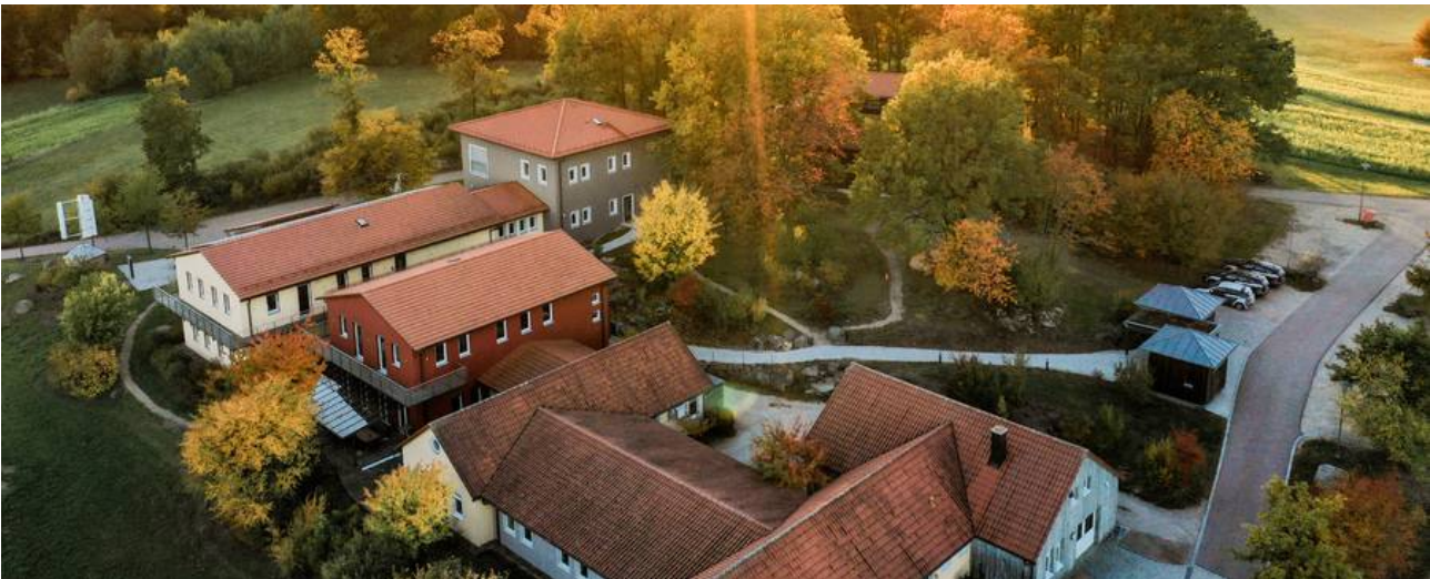
Schiegl IRS-Systems in Brennbach: Vorbildunternehmen in Europa für eine naturnahe und bedürfnisorientierte Gestaltung des Arbeitsumfeldes und Firmengeländes

Erhalt und Stärkung der Leistungsfähigkeit und Kreativität sowie der Freude an der Arbeit sind stets wichtige Faktoren einer erfolgreichen wirtschaftlichen und sozialverträglichen unternehmerischen Einstellung. Auf Basis einer solchen Haltung respektive eines solchen Selbstverständnisses gilt es, die angesprochenen vielfältigen Möglichkeiten auszuschöpfen und Lebensräume und Lebensweisen komplementär weiterzuentwickeln – beispielsweise um der Demografie einer globalisierten Fachkräftesituation zu begegnen. Denn Maßnahmen zur naturnahen Gestaltung der Arbeitsräume und Firmengelände haben durchaus einen positiven Einfluss auf Identitätsbildung und Zugehörigkeit in Unternehmen und Organisationen, woraus wiederum eine positive Innen- und Außenwirkung erwächst. Solche Initiativen können sich mithin effektiv vervielfachen und eine betriebs- und volkswirtschaftliche Relevanz entfalten. Diese dem Menschen zugewandten Perspektiven einer biodiversen und bedürfnisorientierten Gestaltung der Verhältnisse muss verstärkt in offene Debatten um Zertifizierungen in Nachhaltigkeit, Betriebliches Gesundheitsmanagement, Arbeitsstättenverordnungen, therapeutische und medizinische Grundversorgung, Präventionsgesetz und Förderrichtlinien getragen werden. Damit könnte dem allgemeinen Ruf nach Gesundheitsprävention in allen Lebensbereichen und Generationen entsprochen werden.