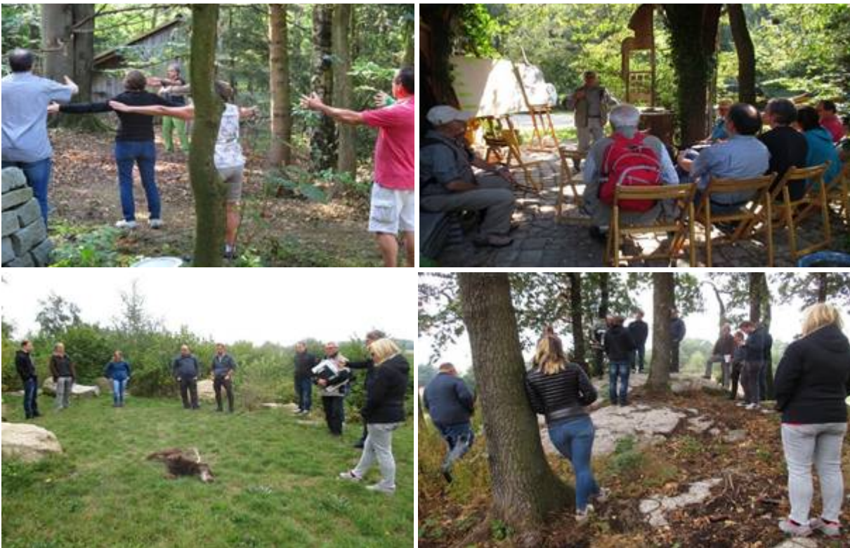
ILbA Workshops zur Vermittlung der stärkenden Verbundenheit von innerer und äußerer Natur

ILbA kooperiert mit den internationalen Projektteams und trägt auf unternehmensstrategischen Ebenen bei zur Konzeption von Maßnahmen für die naturnahe, biodiverse und bedürfnisorientierte Gestaltung gewerblicher und sozialer Liegenschaften sowie von Gewerbe- und Stadtgebieten.