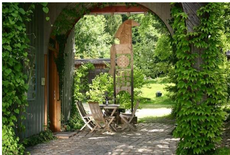
HofLind, Eingang zum Institut, zur Verwaltung und zum Betriebsgelände

Über die Gestaltung von Orten für unterschiedliche Bedürfnisse können bei einer naturnahen Orientierung vielfältige Standortstrukturen entstehen, auf welcher physischen Grundlage eine Entwicklung der erwünschten Artenvielfalt durch angepasste und differenzierte Pflege möglich wird.