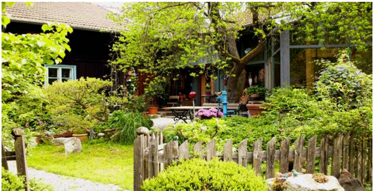
HofLind - Eingangsbereiche von Robl ZeitLandschaften und das Institut