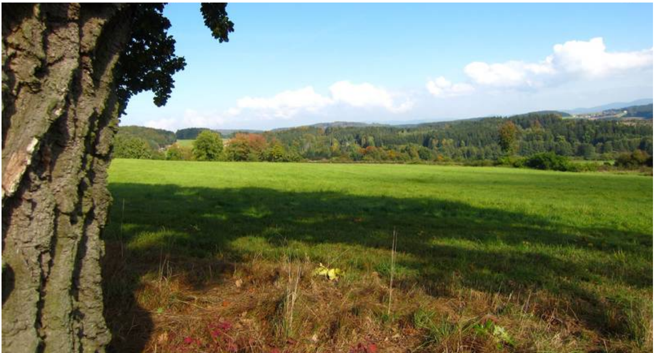
Landschaft im Böhmerwald unmittelbar an der bayerisch- tschechischen Grenze - im Bildmittelpunkt HofLind - Ort der Begegnungen im Herzen Europas - meine Lebens- und Arbeitslandschaft, unser Institutsstandort.

Freiflächen und Funktionsräume können auf Grundlage der naturnahen Orientierung neu gedacht und weiterentwickelt werden. Vegetationsstrukturen an Parkplätzen oder Lärmschutzwällen können beispielsweise eine ästhetische Aufwertung erfahren und zum Ziel der Vernetzung und Integration der Einzelräume innerhalb grüner Infrastrukturen beitragen. Die bewusste Weiterentwicklung des Verständnisses von Biodiversität erlaubt es, Standorte vielfältiger zu bauen und die, durch intelligente Pflege in dynamischer Weise sich einstellende, Mitwelt umfassend lebendiger werden zu lassen.