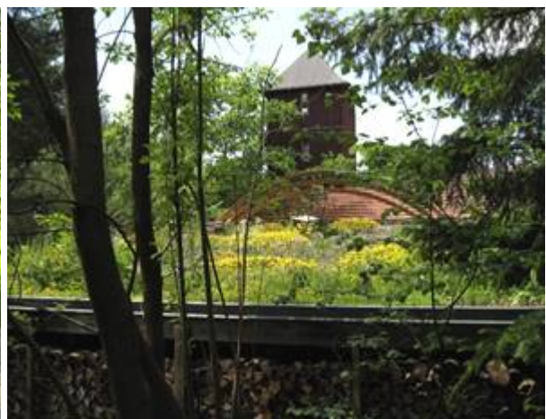
HofLind im Böhmerwald – Einfahrt in das Betriebsgelände, Tanzwiese, begrüntes Betriebsgebäude