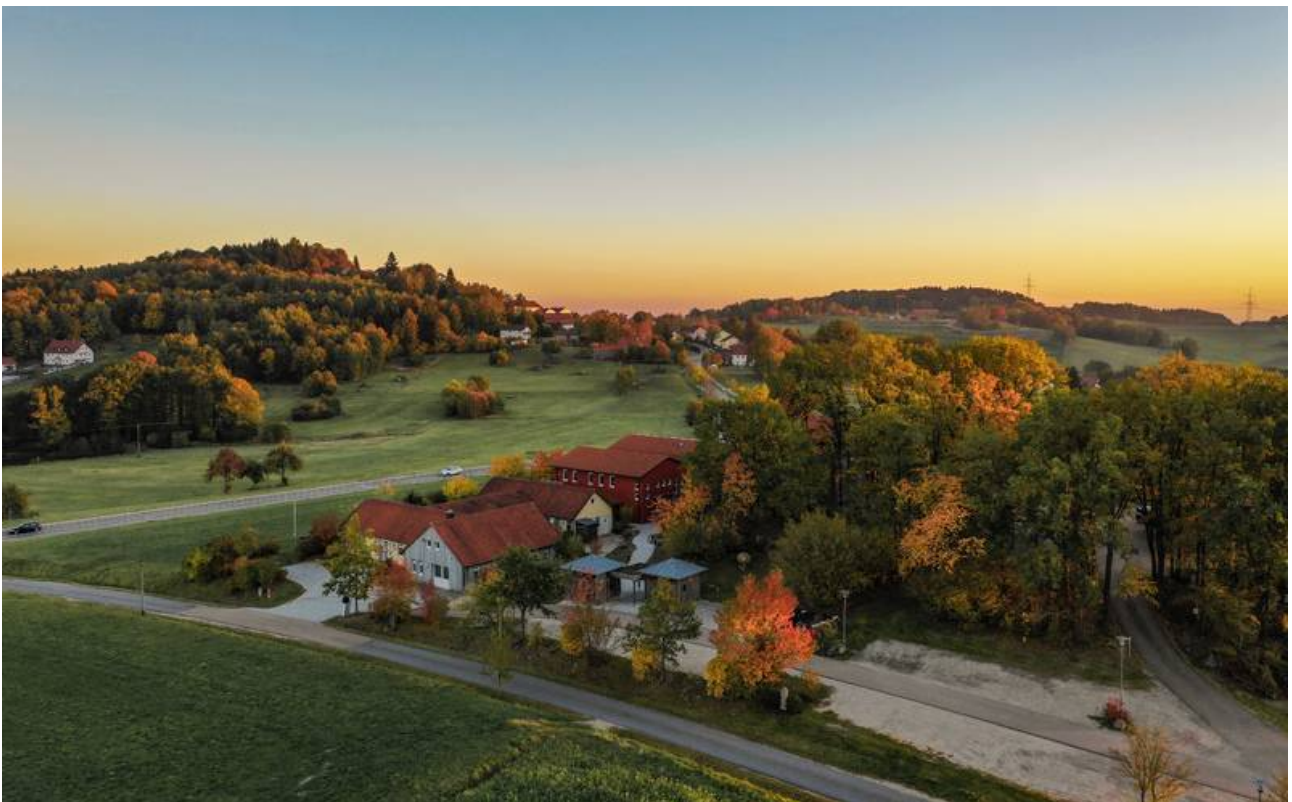
Naturnah und für die Menschen bedürfnisorientiert gestaltetes Firmengelände

Naturnahe und für die Menschen bedürfnisorientierte Gestaltung von Freiflächen an wirtschaftlichen, sozialen und medizinischen Einrichtungen