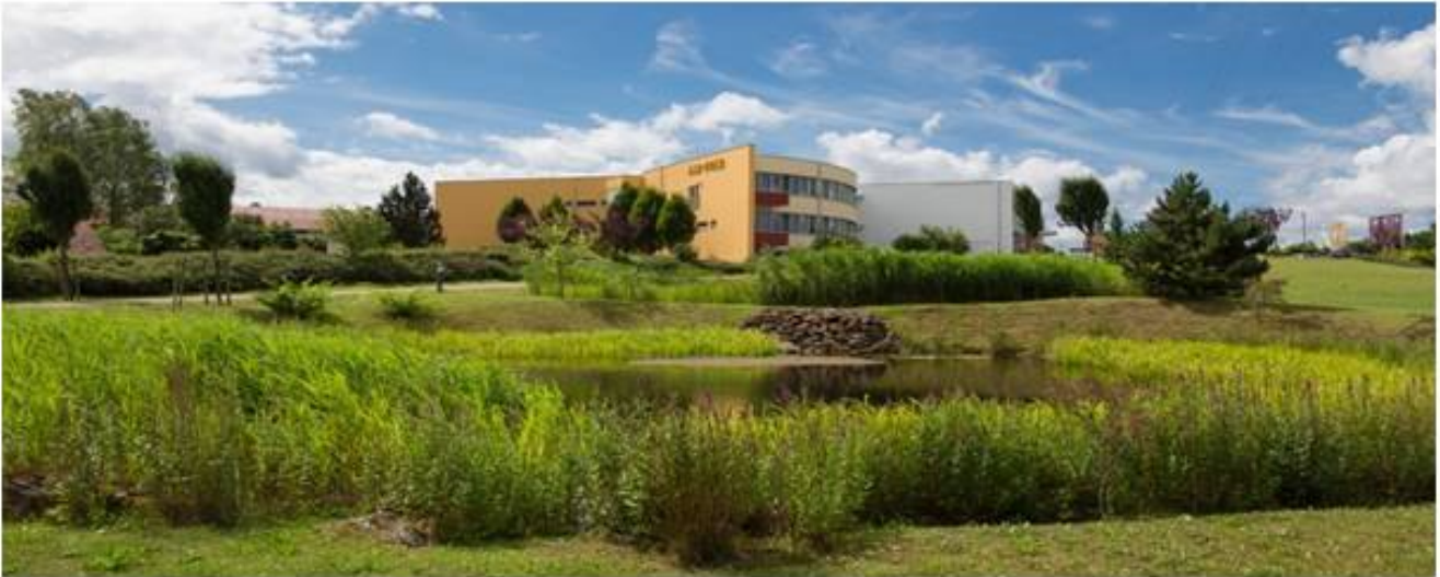
Beispiel eines naturnahen und bedürfnisorientierten Unternehmensstandortes

In unserer Gesellschaft gibt es eine wachsende Zahl derer, die Kompetenzen für die Entwicklung und Erprobung zukunftsfähiger Konzepte einfordern, andererseits aber noch zu wenige Anbieter, die diese Aufgaben in ihrer Fülle auch bedienen können. Wir sind Zeugen einer Situation, die ein grundlegendes, neues Verständnis der Mitwelt erfordert, das auch uns Menschen – neben all den drängenden Überlegungen zum Artenschutz – partnerschaftlich mit einbezieht.