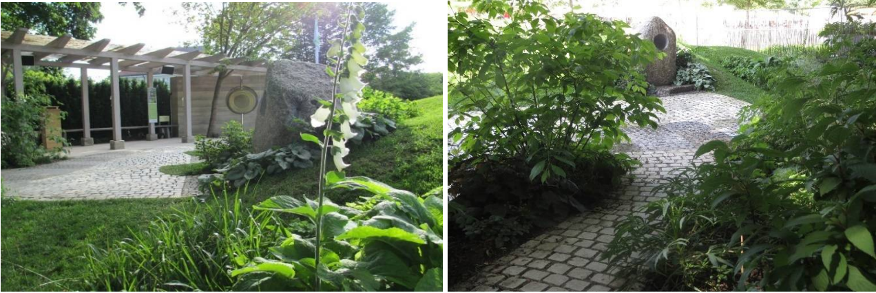
Gestaltungsbeispiel einer multifunktionalen, innerbetrieblich-sozial oder auch gartentherapeutisch zu nutzenden Freifläche - Planung: Anton Robl - Landesgartenschau Tirschenreuth 2013