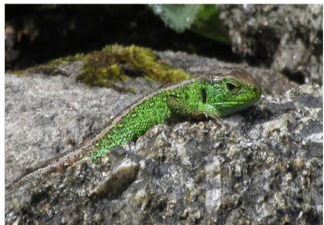
Artenvielfalt als Erfolgsindikator einer Standort-Entwicklung hin zu Healing Architecture